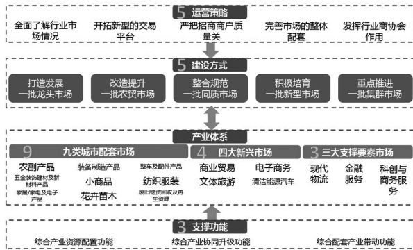
图 1:达州市专业市场群现代化发展“559433”行动计划示意图

城市配套市场、4大新兴市场”转型提质增效,同时夯实现代专业市场群发展的“3大支撑要素市场”,构建引领全市乃至川渝陕结合部的现代专业交易市场体系。